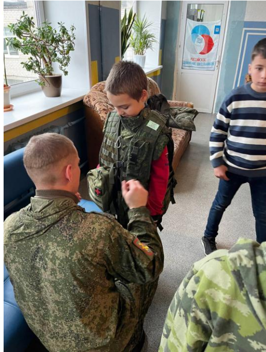
Встреча с героями