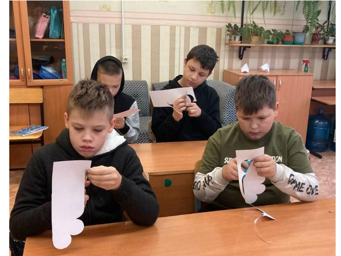
Подарок маме своими руками